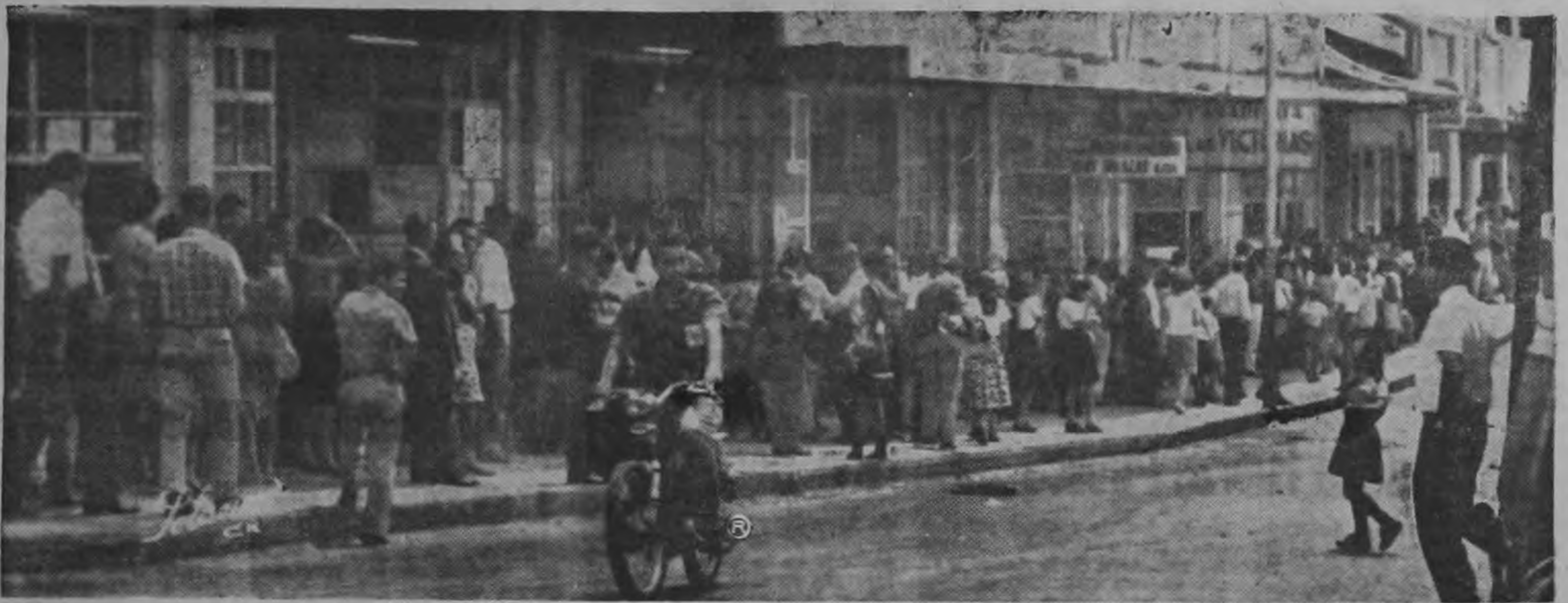
REGULAR TRANSITO DE BUSES A HORAS TOPE. En la gráfica de SOLANOV se aprecia la aglomeración de usuarios que esperaban ayer a las once de la mañana, que llegaran los vehículos que hacen el servicio de la Ciudadela de Hatillo. Los usuarios a veces tienen que

esperar hasta una hora para poder trasladarse a sus casas a las horas de almuerzo. Es de urgencia que la Dirección General de Tránsito o quien corresponda regule la circulación de vehículos a las horas llamadas "tope".