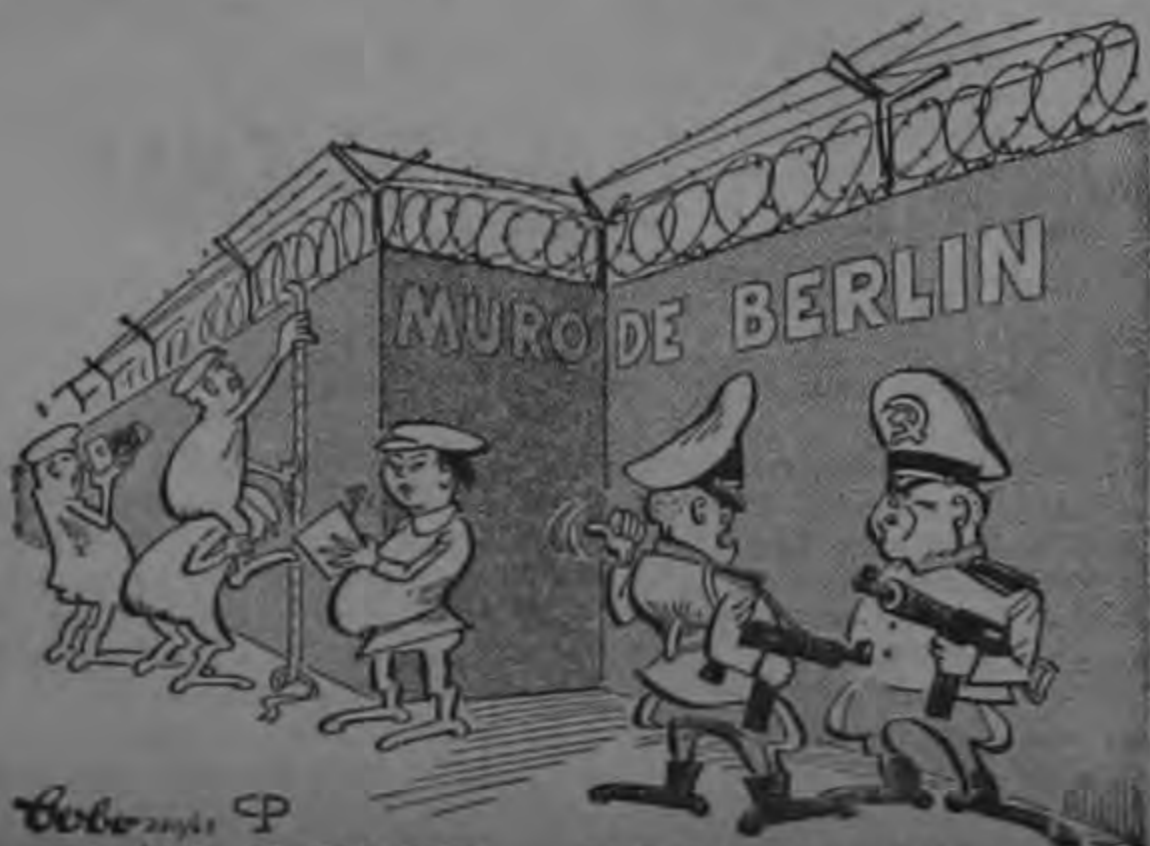
"ELLOS TAMBIEN... ¡QUE BARBARIDAD!"

Desde el punto de vista legal la resolución no obliga a las naciones, por tanto la Unión Soviética como Estados Unidos a probaron la acción y por lo tanto aceptaron la prohibición impartida por las Naciones Unidas.