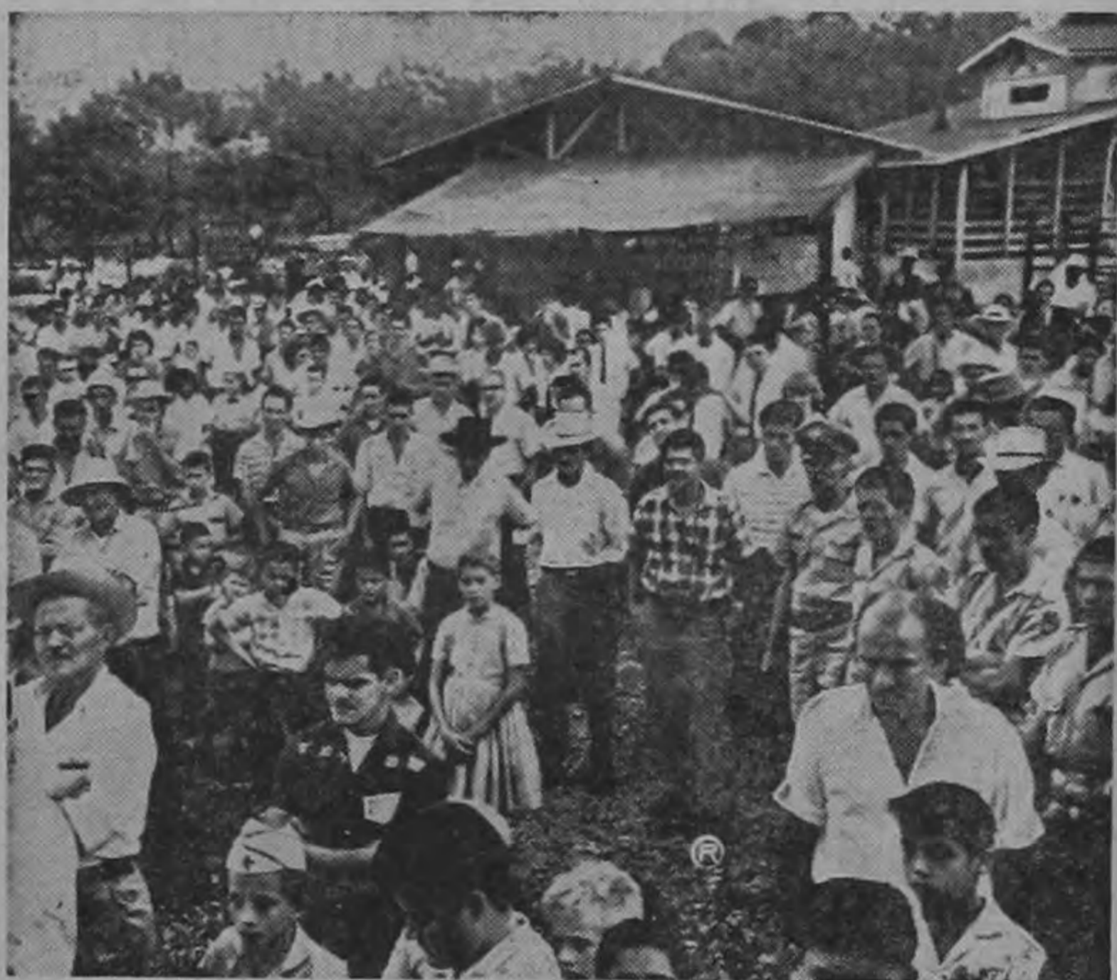
Pequeños ganaderos de San Isidro del General fueron favorecidos con pequeñas partidas de vaquillas enrazadas con Brahama, que el Consejo Nacional de Producción distribuyó en el programa conjunto con el Ministerio de Agricultura y el Banco Nacional de Costa Rica. Aquí se observa a algunos de ellos cuando esperaban se les entregara los Certificados de Propiedad de sus respectivas vaquillas

El Consejo Nacional de Producción, el Ministerio de Agricultura y el Banco Nacional de Costa Rica tienen ante sí la financiación y el desarrollo del plan complementario del Programa de Fomento Ganadero, como es el del mejoramiento de potreros y habilitación de nuevos repastos.