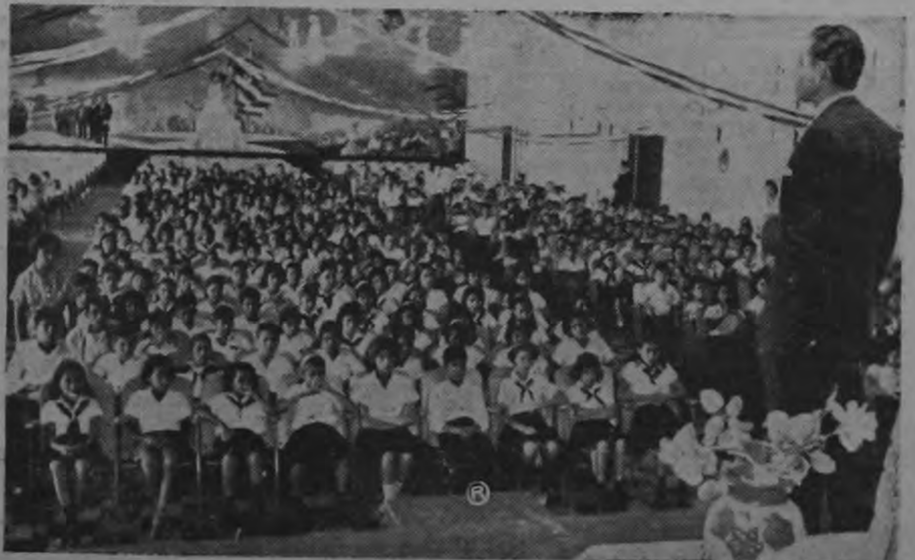
El Embajador de los Estados Unidos en Costa Rica señor Raymond Telles dirige la palabra al alumnado y personal docente de la Escuela