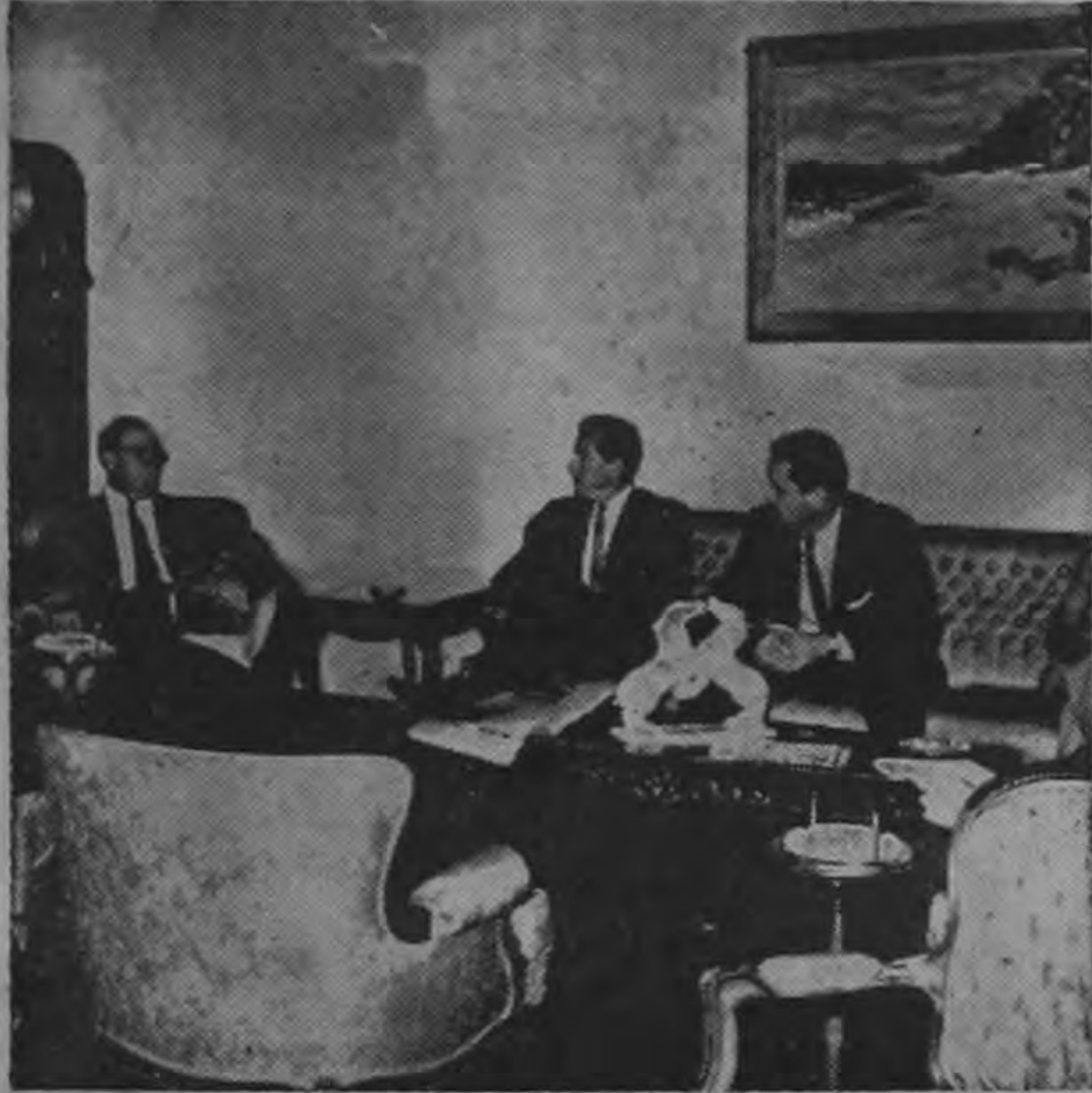
EN LA GRAFICA de ARTAVIA aparecen el Presidente Orlich y los señores aviadores que le visitaron ayer a fin de ofrecer sus servicios al Gobierno en el manejo y administración de los aviones del Estado.